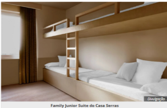
Family Junior Suite do Casa Serras

O Casa Serras tem 62 suítes, distribuídas em oito configurações. As acomodações têm design contemporâneo e janelas que trazem muita luz natural para o interior.