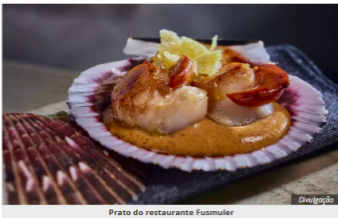
Prato do restaurante Fushmaner