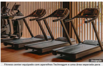
Fitness center equipado com aparelhos Technogym e uma área separada para treinos funcionais

Com um espaço no primeiro andar que combina spa, academia e fitness room, os hóspedes poderão manter sua rotina de exercícios mesmo a mais de mil metros de altitude.